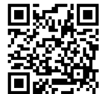
塾生用申込フォーム

塾生 6月1日にお送りするメール内の申込フォーム、または右のQRコードよりお申し込み下さい。